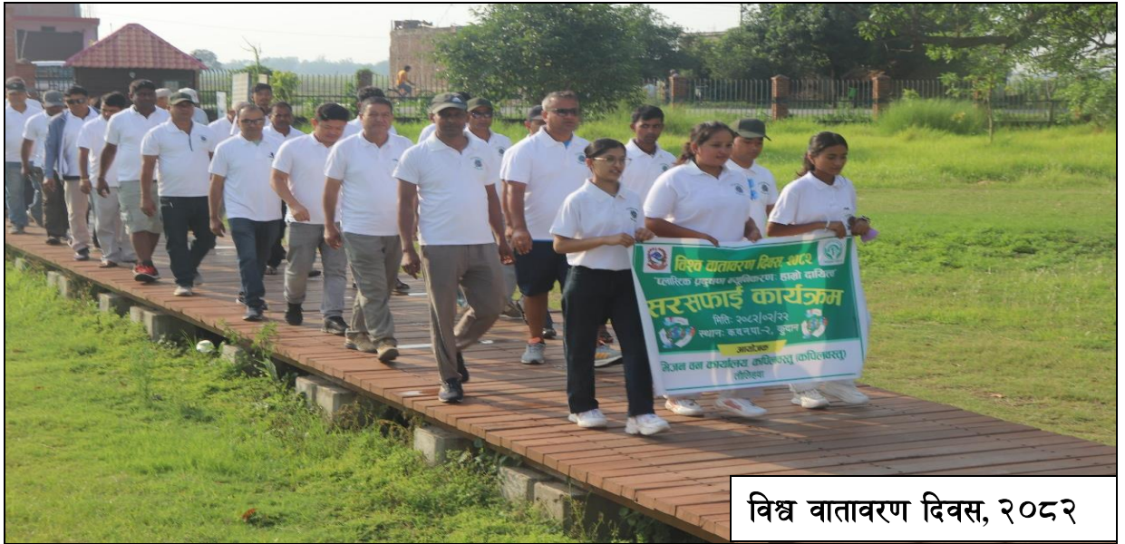
विश्व वातावरण दिवस, २०२२