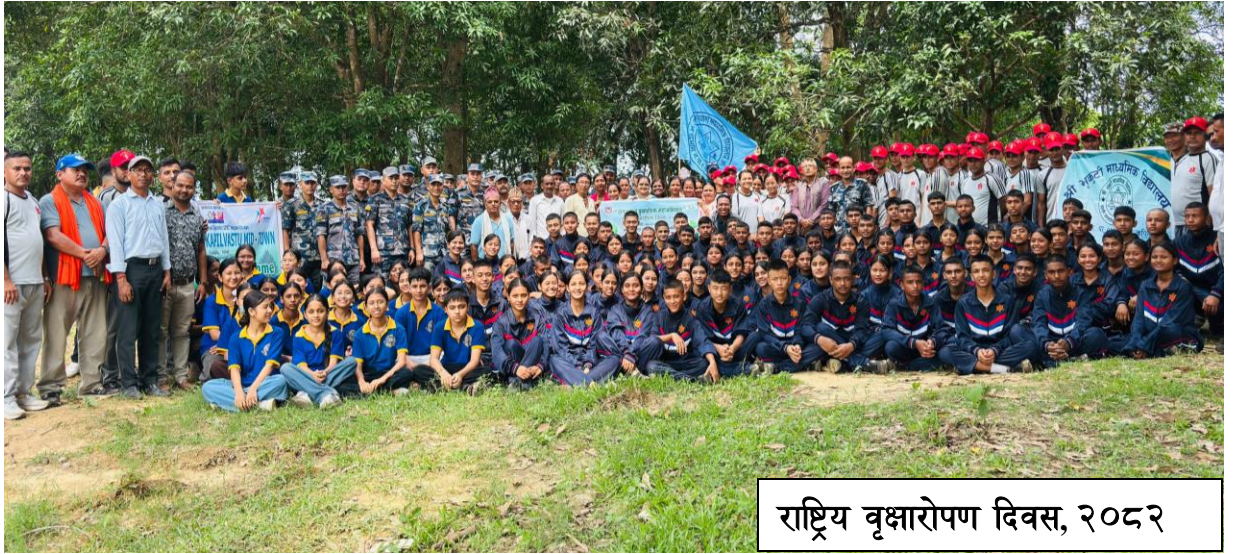
राष्ट्रिय वृक्षारोपण दिवस, २०२२