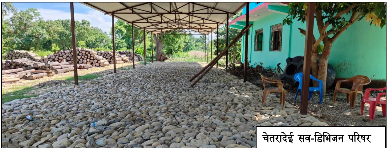
फोटो: सुधारिएको वन पैदावर घाटगद्दी/डिपो निर्माण