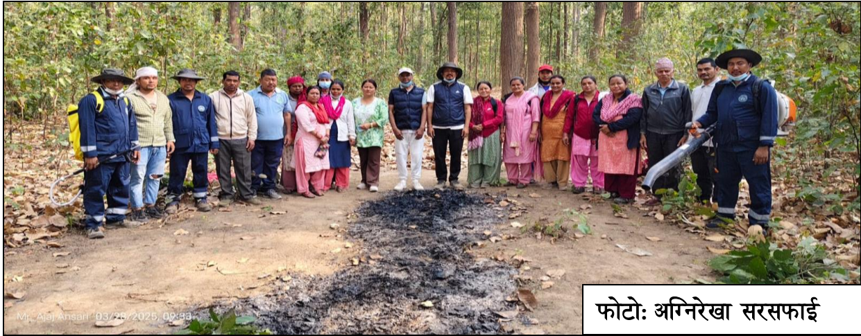
फोटो: अग्निरेखा सरसफाई