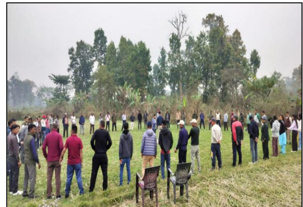
फोटो: तालिम/गोष्ठी/अन्तरकृया कार्यक्रम सन्चालन